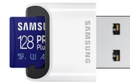
UHS Card Reader